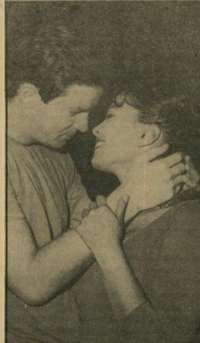
גאולה נוני עם אריק איינשטיין (1968) לא מוכנה לספר על הבעל הנוכחי

לא, אין לה בעיות עם זה שפעם היא היתה חבוכה, ועכשיו היא בתפקיד האמא של עצמה. "מגיע לי להיות אמא, לא?" היא שואלת, "הרי זה לא משהו רע שקורה לי. זאת התפתחות נורמלית