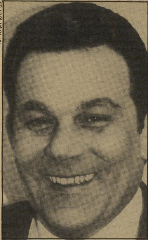
אבו ולחמן, העולם הזה