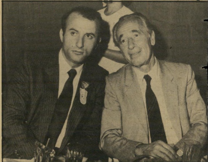
אפרים גור עם שימעון פרס, הנהלים נוספים בדרך־כלל ימינה.

אשדודים ארוכי־זכרון מספרים כי את ימיו הראשונים בפוליטיקה עשה