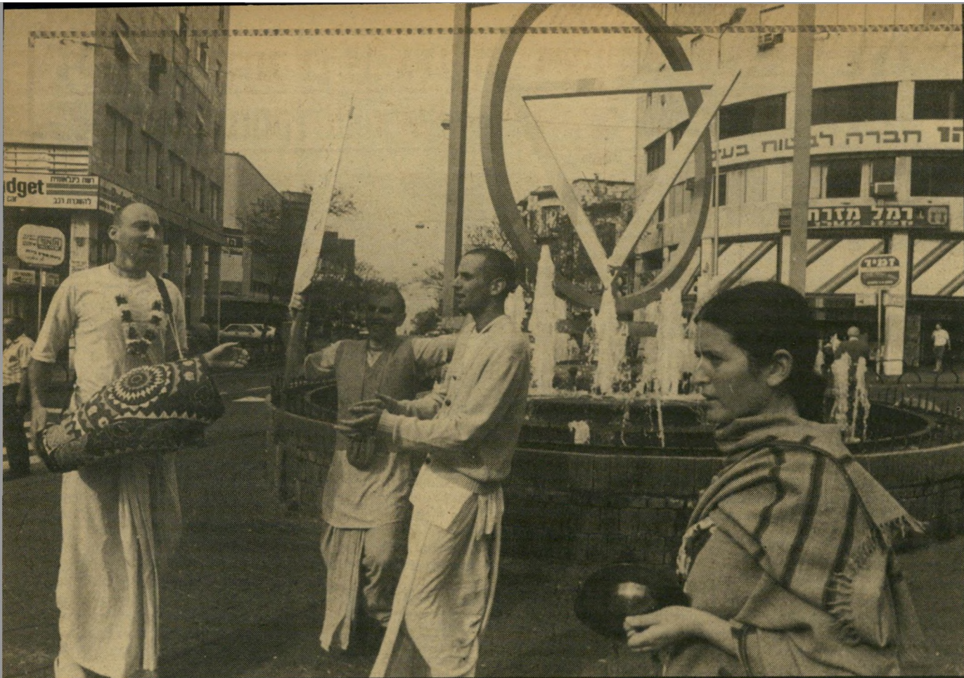
תהלוכת הרא קרישנה בכיכר הנביאים בחיפה בטיפוף עדין מחלקות כרוזים

באחד הערבים הצטרפה אלי ידידה לביקור במיקרדש. כשיצאנו להתאווור אחרי האוכל, היא ציינה: "השקט מה מם. בפנים אף אחד לא צועק. מדברים בנימוס. אנשים באים לכאן רק כדי לברוח מהחוק, מרעשיהמכוניות ומה