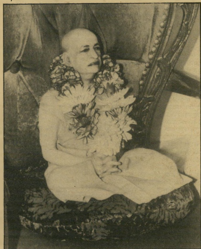
בובה של הכהן פרהבהפאר הספקיות נורמות למילחמה-עולם

המצע הזה עם החוץ מהווה חלק