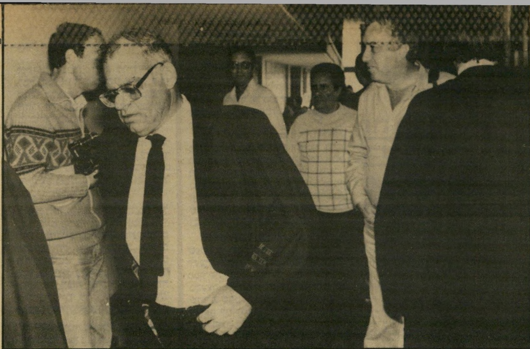
פרקליט־מחוז שדר (משמאל) במישפט לביב (מימין) חבר נחמד יש לך.