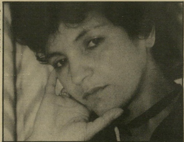
אמ קונסלוס ניור כהלכה