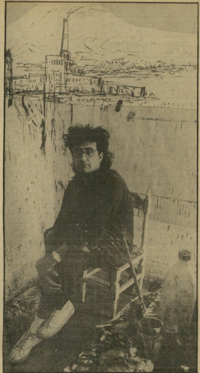
עוזרי, הסטודיו ב"רדינג" וציור צייר נמרץ ופורה

הבליינים הקבועים בעיר, החושב עצמו למבלה גדול. (אחרי כמה כוסיות הורה לפניי שהוא שתיין בינוני.) וזה נשמע כך: אני אוהב להתחכך בכל מיני את יודעת, זה עושה גם אותי כזה IN. אז כשאני יושב במוסד. ואל תתי פסי אותי במילה בעניין. ישיבה במרסר, והמבטים של אלכס אנסקי מת-