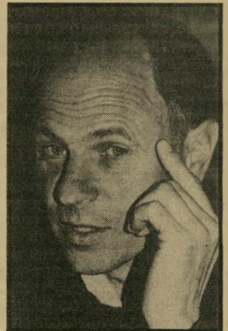
ג'אד נאמי — נמצא בהתאבדות

שובה לכישרון, לאמביציה ולכיסים ריקים. זה מוביל באחרונה את הבימאי יהודה (ג'אד) נאמן (מנש הכסף) ואת המפיק יעוד לבנון (הפנימיה) לזרז עותיה של קורפורציה ישראלית ברישית חדשה: רחובות האחמול. המי צולם בימים אלה בישראל ובגרמניה. סיפור העלילה סובב סביב הנושא היותו-פולוארי בקולנוע הישראלי היום: העימות הישראלי-ערבי. ברחובות האחמול יהודי וערבי מעמידים את היי רידות שביניהם במבחן, ברגע שהאחד מחליט להצטרף לתנועה לאומנית. הסירט מרבר אנגלית. אקטואליה שימושית מאוד, שחררה גם לטיפרות ולתיאטרון. אבל בניגוד לאחרים, הקולנוע הישראלי, מסתבר, הוא בגדר חלום. מאוחר יותר אמר לי ככאב המפיק יעוד לבנון: "הקולנוע הישראלי נמצא בהתאבדות. אין קולינוע ישראלי. מאה צלמים, בימאים ומי