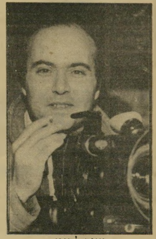
יעוד לבנון — הקולנוע הישראלי

יש יותר מדי חלומות על קולנוע ישראלי טוב, ופחות מדי סרטים העובדים טוב מול עינינו. אני לא יודעת למה, אבל משהו בורח להם, וגם בעוד נתימלפפונים הם מחמיצים את מה שהם עושים. הבריחה ההמונית הזאת אל הקורפורציות הקולנועיות היא אולי הת