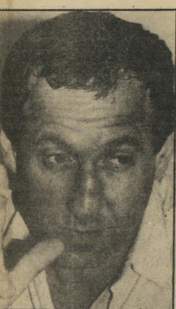
שדרן גזית אני ספיקה בבייביס

אם. היא הזהירה את הכתב שאם הוא אחד משני העיתונאים, סופו יהיה רע ומר. כששאל אותה הכתב מדוע מטריד דה אשתהמוסד את זר, השיבה שלפני שנתיים היה בין השניים רומאן, וכשזה הסתיים נשארה חברתה שבורת לב, ועלי-כן החליטה להתנקם בו בעזרת חב-רותיה, עובדותהמוסד. בעדותה בבית-הדין סיפרה מיי מון שהיא עצמה ניהלה רומאן ארוך עם זר. לטענה היא ניתקה את הקשרים עימו כשגילתה עליו פרטים שלא ידעה