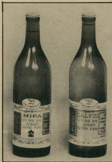
מים מינרליים בריאות חוצרת הונגריה

סוג חדש של טירולים — שקרים מצופים בשיכתב-שוקולד ובשיכתב-סוכר ציבעוניות —