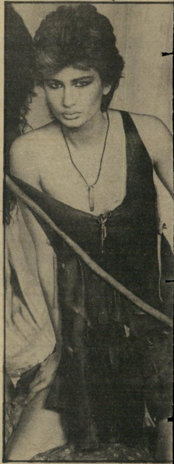
דוגמנית קלצ'ינסקי מצטלמת טוב

וכמו שקורה אצל רבים, גם שהותו של ביל שפירא כאמריקה התארכה והתארכה. פתחתי מישרד לתיווך