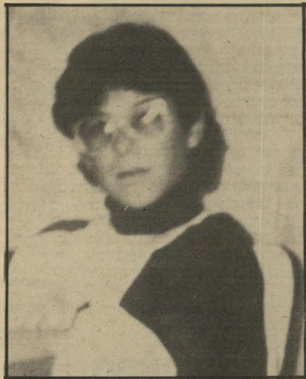
קורבן תירצה פורת שום ערבי לא ירה

עצר צעיר ערבי, בן 25, שהיה בשרה עם אמו. אלדובי שאל "איפה המעיין? הצעיר אמר שאין בכסיכה מעיין. הצעיר יעץ לאלדובי שלא ללכת בכיוון לכפר. אלדובי התרגז. התפתח דיוורברים, מלווה בקללות. אלדובי ירה ופגע בצעיר. האם רצה לעי-בר הכפר, כשהיא זועקת בכל קולה. לפי סיפור המטיילים, הם הלכו לעבר הכפר