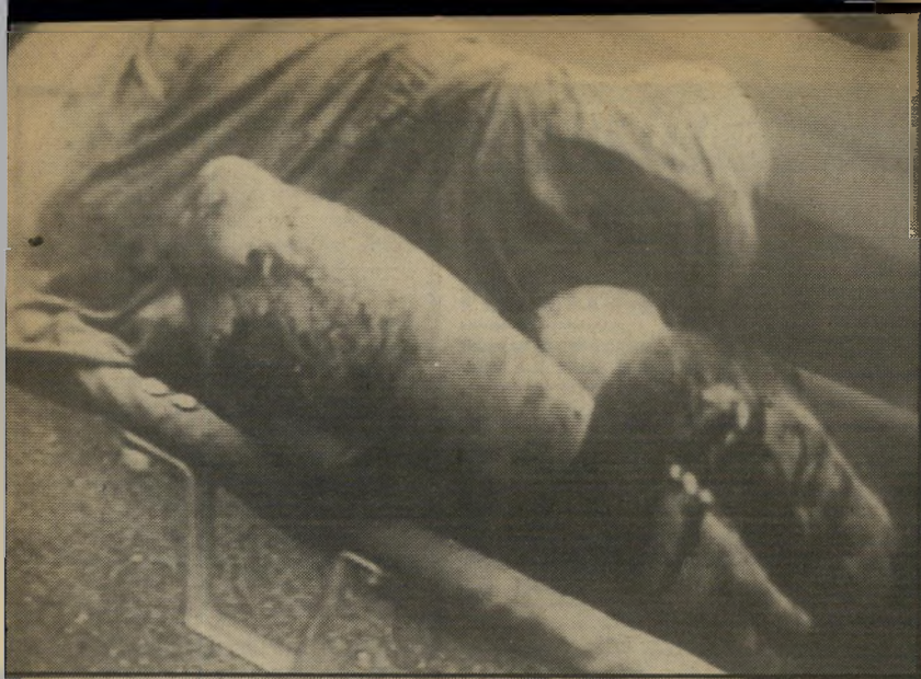
מדריך אלדובי פרוכטור וקואי תימוני

● הארץ: טיול הדמים: בת 15 נהרגה מפגעי עת אבן בראשה. צה"ל: המסלול לא תואם עימי נג" (הארץ לא סיפר גם בארבע שורות של כותרות-מישנה שנדרגו במקום ערבים). ● דבר: "מאמצים למנוע פעולות נקם בעיקבות רצח תירצה פורת. קריאה להלווייה המונית היום." ● עול המישר: "תקרית דמים בין כפריים למתנחלים: נערה מאילון-מורה נהרגה באבן, 2 תושבים נורו למוות." ● גרוסלם פוסט: "שני ערבים נהרגו בהתנגי שות בכפר — נערה מתנחלת סוקלה למוות." אף שכמה מן העיתונים היו פחות היסטריים מהאחרים, אף עיתון אחד לא מילא את תפקידו לנסח כותרת שתמנע היסטריה. כפי שהסתבר חיש מהר, אף כותרת אחת לא היתה נכונה. כל העורכים ידעו, כמובן, שאין בידיהם שום מידע ברזק, וכי הם ניוונים על תעמולת המתנחלים. רוב העיתונים התייחסו אל מות הערבים כאל עובדה שולית או מבוטלת, לעומת "רצח היהודיה".