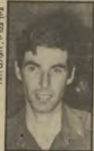
מיכאל הרצוג איפה הם נרמ?

רדינג-דונגני לה מיספר פעמים, אך לא הצ' לחתי ליצור עימה קשר. אך השפיונים שלי עדיין עוברים עליכר, ואני מבטיחה ליידיע אתכם בהק' רם האפשרי.