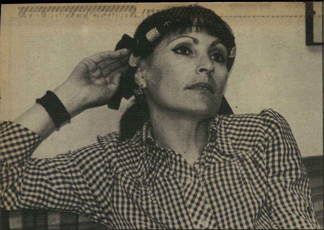
בין צעירי העולם הזה