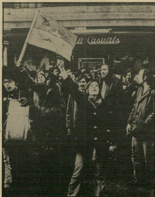
ג'יין אלפרט בתמונת־המזאה, 1969

התמונה הכללית היא מינשטיין וחבריו. אלה המהפכנים הפכו לבו־גנים. הם השתלבו בחברה. לא נותר הרבה מרעיונותיהם המפור־ארים.