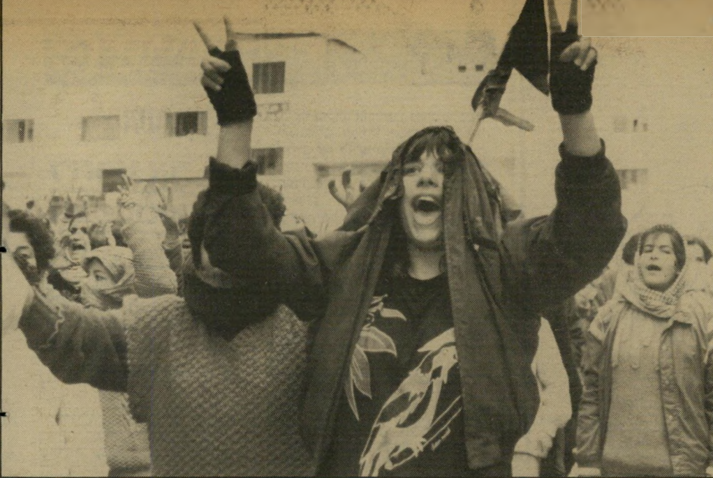
ענין שיגרת תלמידיים

סגןהמנהל זינק אל הבימה, אחז ברמקול ותבע על האורחים הלא-קרויים אים לעזוב את תחומי ביתהספר. הל לו, לא רק שלא נענו לתביעתו, אלא גם פתחו כשאגות. לא ניתן לפושע, לדבר כאן? צעקו. הנגיבי הוא פושע, שמשתף פעולה עם המחבלים! הוא סוכן של אשף ואסור לתת לו דרבי! דמעות בעינייהם. מפה לאוזן נלי חשה השמועה שנציג התחיה, המשמש בפועל כמוזכיר מפלגתם של גאולה כהן ויובל נאמן, מלווה באנשיכהנא. סגן המנהל, חיוור כסיר, שב אל הבימה וקרא לאישיכ"ף לצאת מחצר בית הספר. לשווא. תלמידיים סיפרו, כי התכוון ברבריו לצעיר מוכר, שאך יומיים קודם לכן חדר לחצר וחילק כרזים של מאיר כהנא. כאשר ניצב לבדו בחצר שכנידו כרוזים, לא עמד בו הכוח לסייב רב והוא מיהר לסתלק עליפי הוראת המורים. הפעם הרגיש חוק וזכה בגיבוי נציגהתחיה — לא רק שלא הסתלק, אלא היה פעיל בצעקות ובאיזמים.