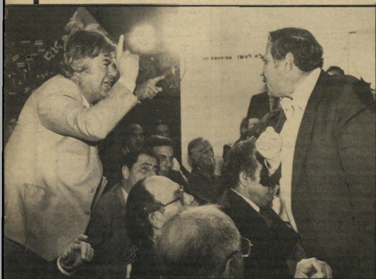
שליטא בוויכוח פוליטי במיפלה. ינידו שניסיתי להתעסק עם אשתו של אלוהים!

את האמת המלאה ניתן יהיה לברר רק אם תתגלה זהותה של הגברת. מכיוון שהיא נשואה, על פי מודעתה, אין לה בוודאי עניין בהזדהות. ואילו שליטא עצמו טוען שאינו יודע כלל מי היא, מכיוון שכל העניין הרי לא היה ולא נברא.