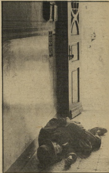
מנוחת צהריים: קבצן בפתח בית (1939)