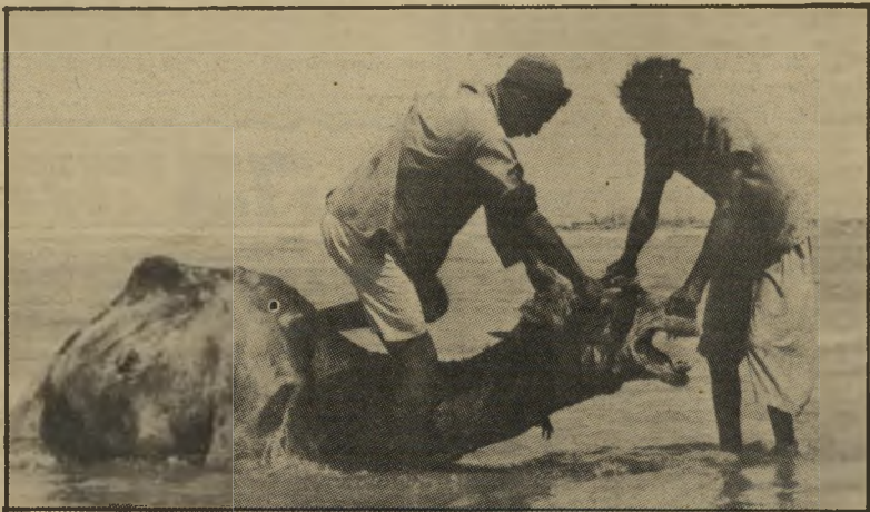
חוף תל-אביב: אמבטיה לגמל

מאז אותה תערוכה קטנה בשנת 1936 ועד עצם כתיבת שורות אלה לא טרח שום גורם