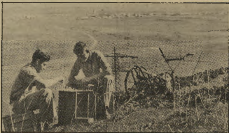
מישחק שחמט תחת כיפת-השמיים