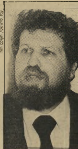
פרקליט לנד"שטיין האזנה בחדר הקטן

כאשר ניסה גבריאלי לעבור את ביקורת-הדרכונים, התברר לו שיש מיברק האוסר את יציאתו מהארץ. הוא הזעיק את סניגורו וזה בירר