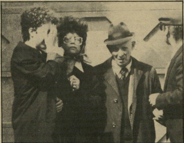
הורי הנרצחת בהלווייה החברים סיאנו להיפד מהקבר

כנען. הוא קבע זאת מבלי שברק אותו, ומבלי שאף נפגש עימו.