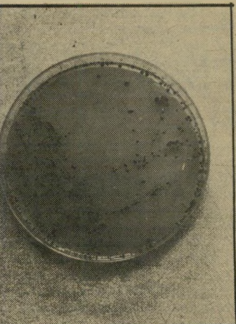
התרבות גם טוונה מהקופסה

שלה, בתנאים הרגילים ביותר, מזה אחת של אוכל. השארנו את האוכל לילה אחד בתוך המקרר, ולמחרת שלחנו אותו לבדיקות במעבדה. כלי-העבוי דה במיטבחים נחצו כרגיל. אף באחד משלושת הבתים אין מבונה לשיטת-יבלים. אף אחת מאיתנו לא הרתיחה את הכלים. שלושת הבתים הם בתים רגיליים לגמרי, ובפירוש לא מה שנקרא "מזורפים לניקיון".