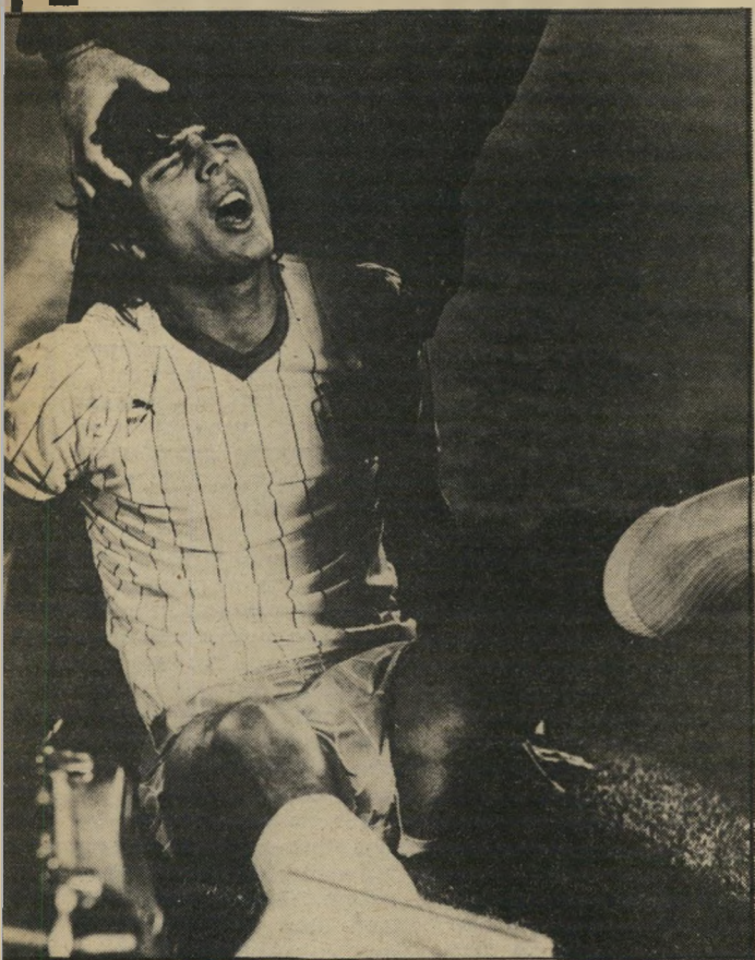
כדורגלן אחנה ושאר בבה וציפץ על כולם