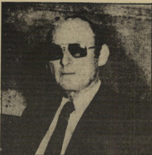
רפפורט קשרים מסונן מסויים

העיראקי יהיה "חסין מפני יוזמה או פעולה צבאית ישראלית כשאר פרובוקציה".