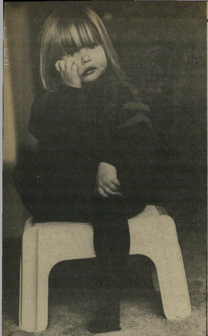
בר הוגה. אני הכי אוהבת פתיחים, בורקאס ושקדים

היא מעיפה בכתה מכט חטוף ומוסיפה: "אבל קשה לי להאמין שהיא לא תהיה יפה". ציפי עצמה, עדיין יפה, אבל בלי אותה גיורה חטובה של פעם. "אני צריכה להוריד 10 ק"ג. תמיד אחרי הריונות אני משמינה. בהריון האחרון (של בנה בן השנה וחצי) שמנתי ב-42 ק"ג. הוא לא מקנא בכך, היא אומרת, גם הוא יפה כמוהו."