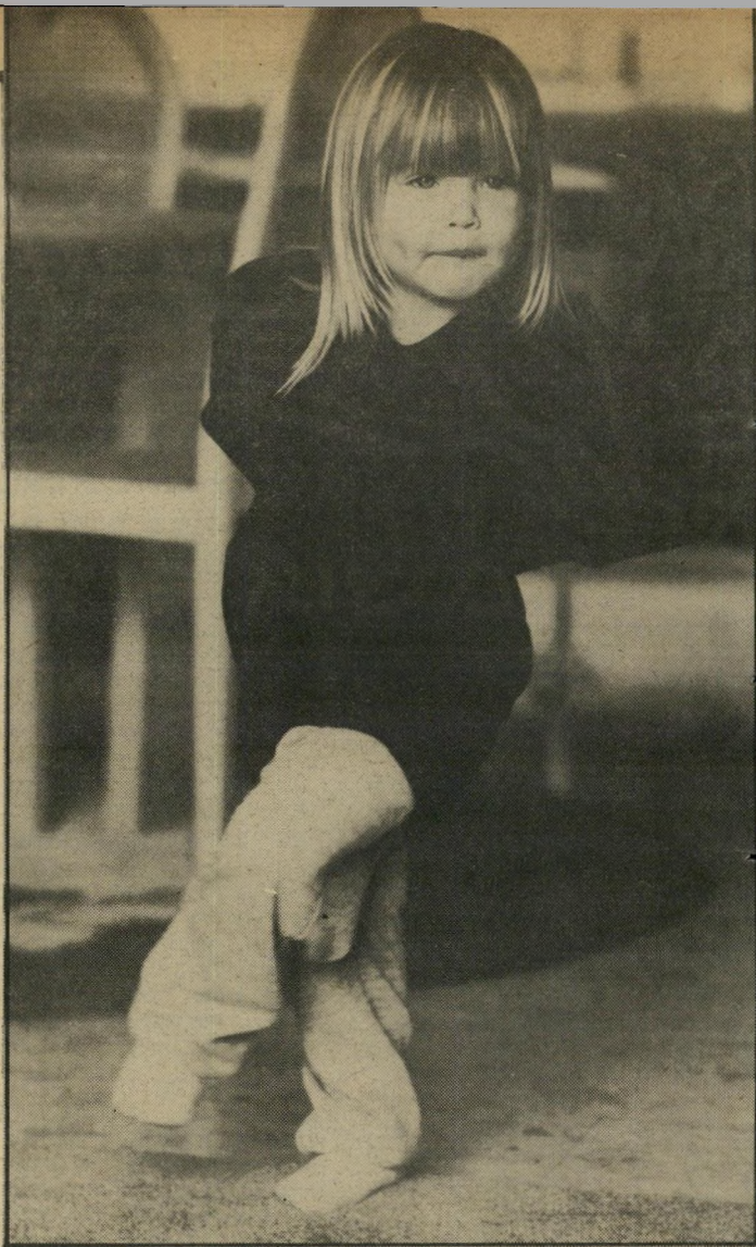
בר עורכת חזרה לקראת התצוגה בארץ משלמים סכומים מנוכחים

את הטענות הנשמעות נגד שיימוש בילדים כמפרסמים מוצאים היא מבטלת. "זו הבת שלי וזכותי ילד עם ציציות וכיפה, ילד קטן שלא יכול להחליט, והולך ככה בגלל שההורים שלו אומרים לו, אני לא אבוא כטענות להורים שלו. כל אחד אחראי לחיים שלו. מה יהיה אם היא תגרל ולא תהיה כליך יפה? אני לא פוחדת מזה. שתהיה מה שתהיה, העיקר שתהיה מאושרת."