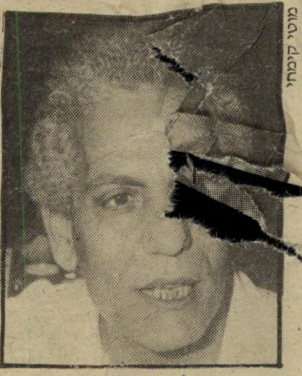
מלונאי מיוזרחי בעל רשת-מלונות בישראל