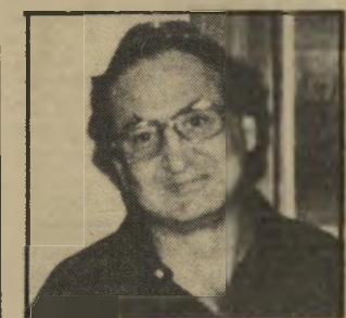
בעלי-חנות מוסאויף יסגור את העסק

המלון בחמישה מיליון דולר. סופר רשע עד כה 40. כיוון שסטיין הוא בעל היזכיון הבלעדי לניהול המלונות, ובידו המפתח לריווחיות, הרי שהוא מתחייב כידו את כל הקלפים, ויכול לאלץ את בעלי הנכסים למכור לו את המלונות כוול. סגירת חנות-התכשיטים של מוסא-