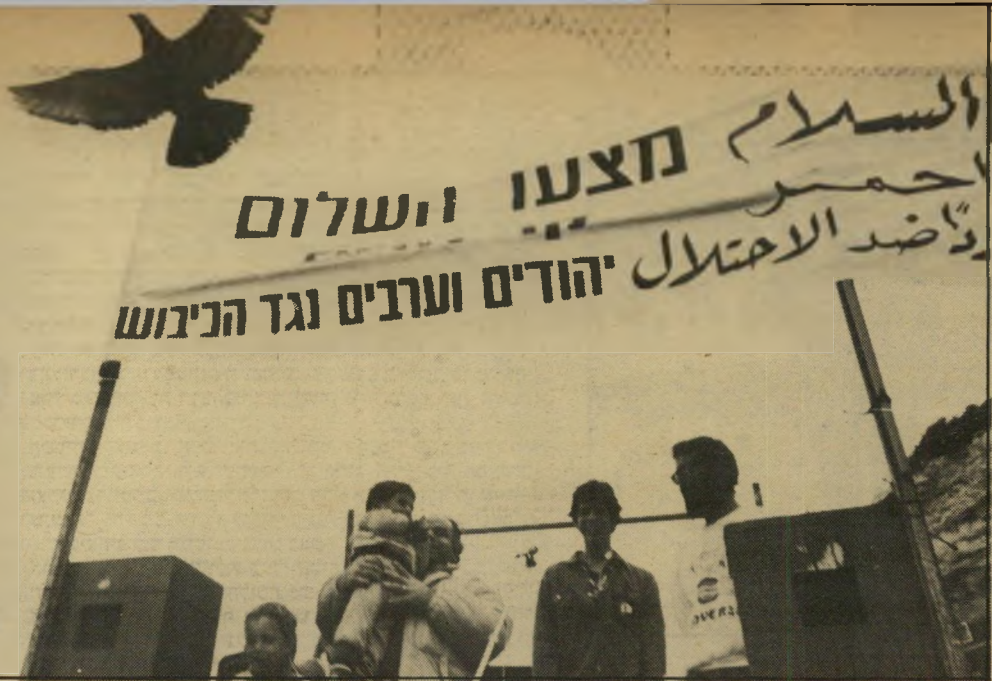
עצרת "הקו האדום" בראשי-הניקרה החיילים זרקו אבנים