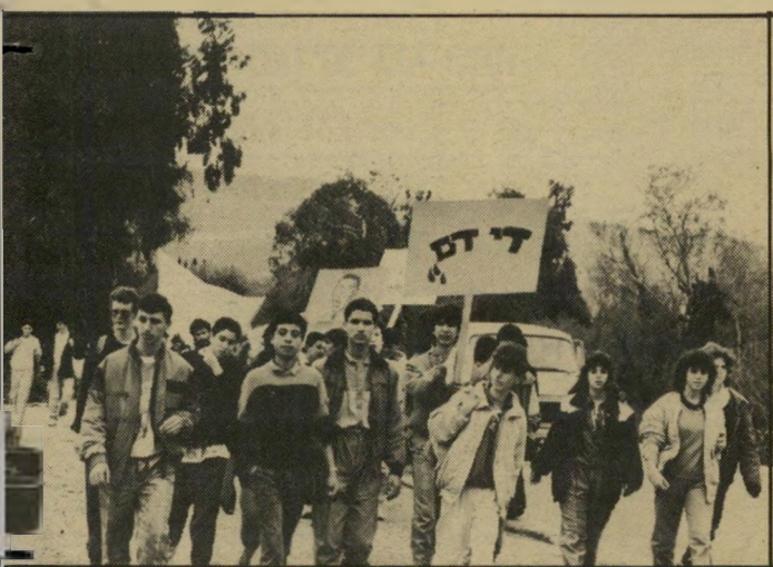
צועדי "הקו האדום" בגליל אחת ערביה, אחר יהודי

למרבה צער, זמנים אלה עברו ללא-שוב. ההתקוממות שמה להם קץ. ערמונים מן האש. שאר המנייגים הערביים פעלו בהתאם לאיני-טרסים שלהם במציאות של פברואר 1988.