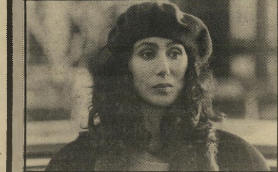
שר (בתפקיד פרקליטת-מדינה ב"השררה") שניים חומות ענקיות