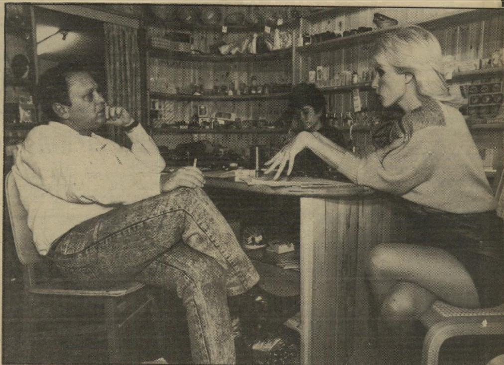
פגישת-עסקים אצל ספק, עברו הימים שהייתי פראירית

היום שלי. כל בוקר אני בודקת מה המצב בבנק. אתמול הופעתי בבאר-שבע ועכשיו אני רוצה לבדוק אם הכסף מההופעה נכנס.