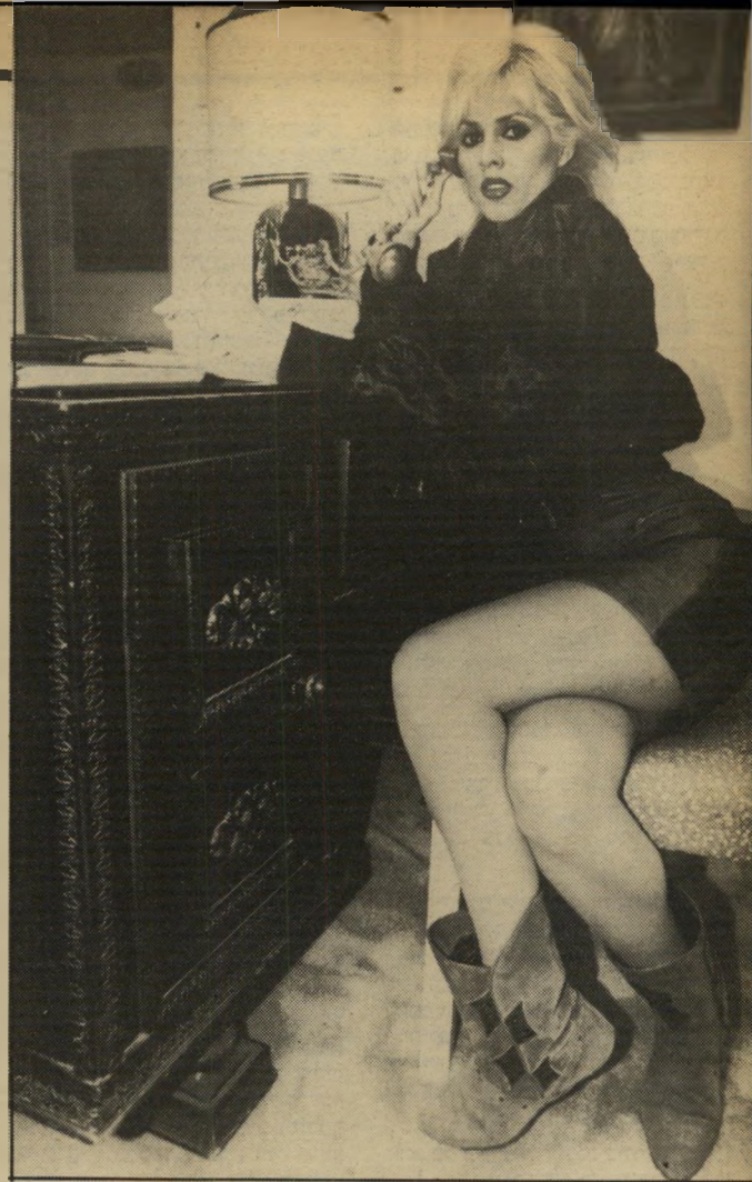
ליד שולחן-העבודה בבית הרווחתי הכל בזיעה ובעבודה קשה

דפיקה בדלת. בפתח אמרגן שמומין אותה להופעה. שיחה קצרה. התאריך נסגר. על התשלום יש ויכוח קצר. קצר מפני שפנינה מסיימת אותו במהירות. ידה על העליונה. אחר-כך היא נפרדת מהעוזרת ב:להתראות מותק, ויוצאת ליום-עבודה עמוס. התחנה הראשונה בבנק. זה כבר הפך לחלק משיגרת