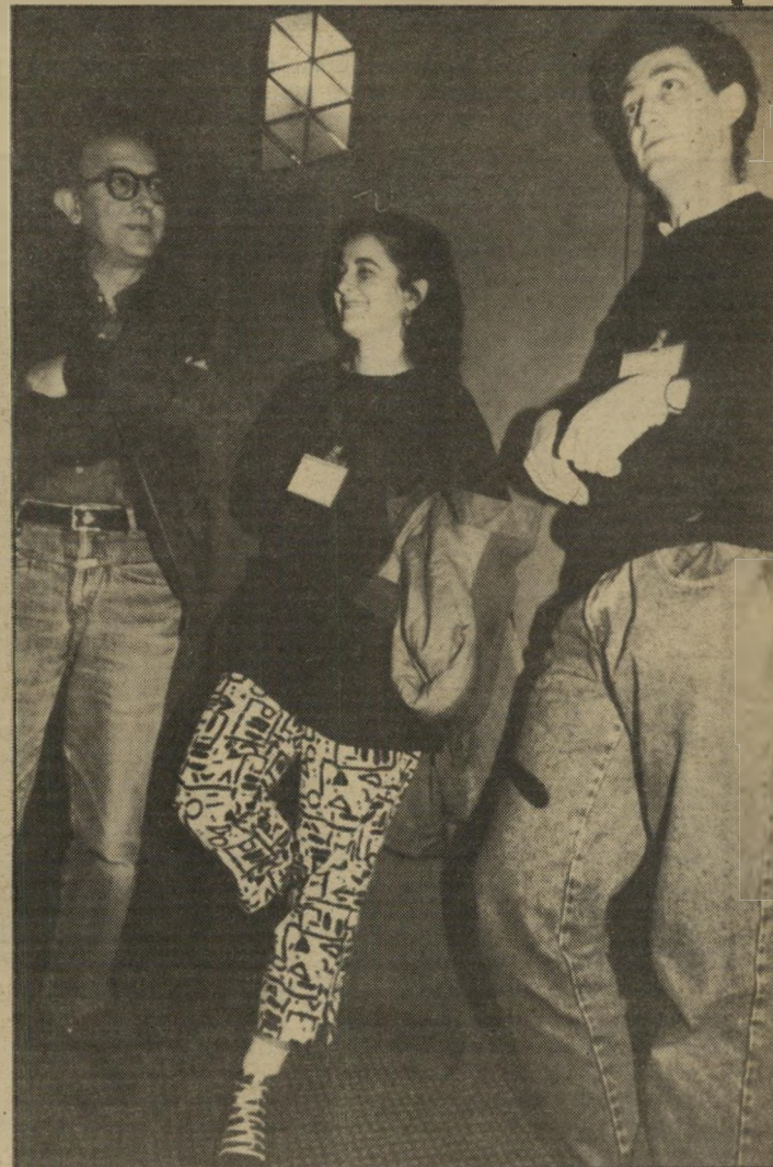
ישראלים סיוון וביטון (עם עיתונאי מארוקאי) מארוקוישראל בצרפת