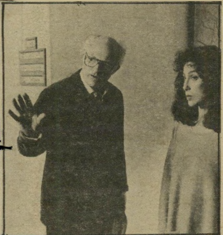
שחקנית שר ובימאי ייטס בסרט, חשור

*** גן השיש (חבלת, ארצות-הברית) — טרם על ויאטנאם מן החזית שבפורף. גיימס קאן וג'יימס ארל-ג'ונס מצויינים כמי שהיו פעם לוחמים ועתה נאלצים להסתפק בתפקידי-פיקוד על היחידה המובחרת של הנשיא העוסקת גם בקבורה בקבלנות. הרילמה הרגילה — האם מספיק להיות ראש קטן? *** הבלתי משהודים (מקסים, ארצות-הברית, מוצג גם באורניל בירושלים ובעמון בחיפה) — מתחך-פעולה או פעולון הומוריסטי המשמש אנדרטה בידורית לתולדות הגאנגסטר האמריקאי. שון קונרי נפלא. רוברט