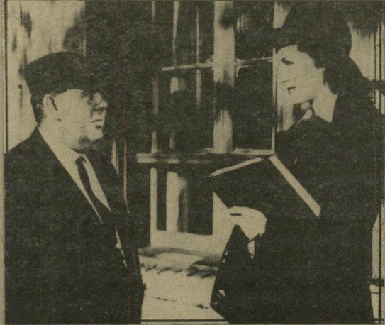
מורין אוהרה וצ'ארלס לוהטון: הצגה דרמטית

הטראומה שעובר המורה היא קיצונית. הוא מבין סוף-סוף מה מתרחש סביבו. הוא חוזר לחיות כד' אמותיו וכאשר הוא יוצא לחופשי המעשה הראשון שהוא עושה הוא להרצות לפני תלמידיו בבית-הספר על מגילת זכויות-האדם ועל משמעות החופש. בכך הוא גוזר את גורל-דניו ללא כל אפשרות של עירעור.