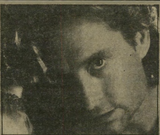
מייקל דאגלס: מילחמה גלויה נגד שיחורו האשה

היא מטרידה את הגבר, יורדת לחיי, מנסה לכפות עליו את נוכחותה, רוצה להרוס את נישואיו ולזכות בו בלעדית. כשלא הולך בטוב, היא מנסה ברע, וכשלא הולך ברע, היא מנסה שבכין ובאקוזה. זאת, עשה שהמרקליט האומלל מתלבט כיצד להימטר ממנה מבלי שהדבר ייודע לאשתו. שאותה הוא באמת אוהב.