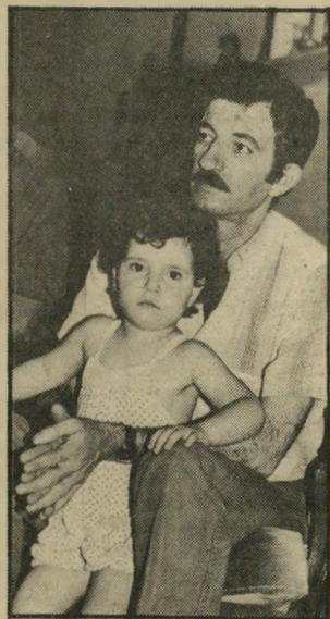
יועץ שקור (1982) — אקסודוס משלנו?

הסתבך גם הוא עם השילטונות, יצא מהמדינה, הצטרף לפת"ח ומכהן כיום כיועצו של יאסר ערפאת לעניינים ישראלים. אקבל אחמד הוא פאקיסטאני החי בארצות הברית, הוגה דיעות הכותב מדי פעם בעיתונים אמריקאיים. אף השלושה גילגלו את הרעיון, וכך התגבשה ההצעה להעלות פליטים פלסטיניים על אוניה שתשוט לחוף ישראל, כדי להציג לעיני העולם האדיש והשאנן את הטראגדיה של הפליטים הפלסטיניים.