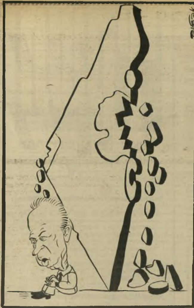
„כשיהיה שקט, נדבר איתם!“

יש הברל עצום בין בעייה, המופיעה במאמרים ובספרים, לבין בעייה ההר