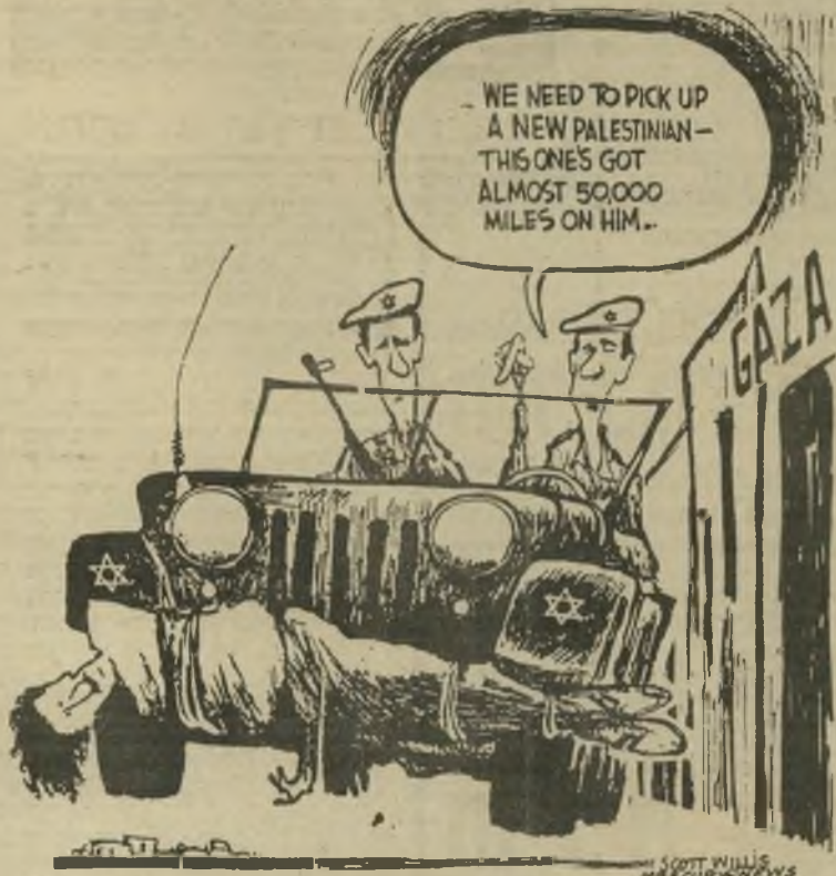
כך רואים אותנו האמריקאים לך חסביר להם

על תגובת אמצעי-התיקשורת למרי האזרחי (העולם הזה 17.10.87 והלאה).