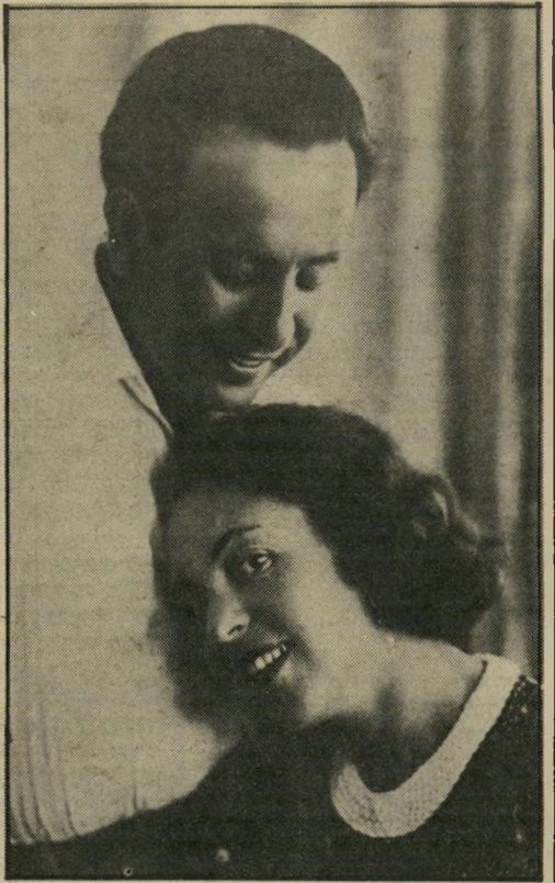
עם אשתו ניורה, בנעוריהם ולפני ארבע שנים, אשתי לא מסוגלת לקום“

סיפרו שרודנסקי הגיע לבית-החולים עדיין לפני ההתקף. זה קרה כששהה כבר בבית-החולים, במחלקה לטיפול נמרץ.