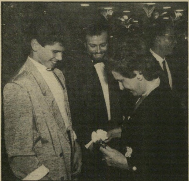
אשת נשיא-המדינה, מקבלת פרס-ציפורן מדויד ברק, שחגג את טקס ברה-המיצוה שלו בתל-אביב. רחל זרנוג, סבתו של דויד ברק, שימשה במשך 20 שנה כסוכנת-בית בבית-הנשיא בהרצליה, וטיפלה בארבעת ילדיו. אמו של דויד ברק, פנינה, הנאמנה לשושלת הנשיאותית ולמסורת המישפחתית, שימשה בימי-צעורה כשמרטפית בבית-הנשיא.

■ ביום החמישי האחרון, בד מן ששימעון פרס, ישראל קיסר ועוזי ברעם ישבו והתיידינו בחדרו של ברעם במרכז