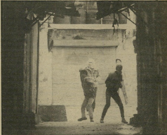
אבנים בקסבה משה שי צילם בקסבה של שכם. "החייילים לא פחדו כלל, והמשיכו ליידות אבנים. זהו מאבק יומיומי. זהו המצב האמיתי בשטחים הכבושים. על-ידי הצגת האמת אני מביע את מחאתי."