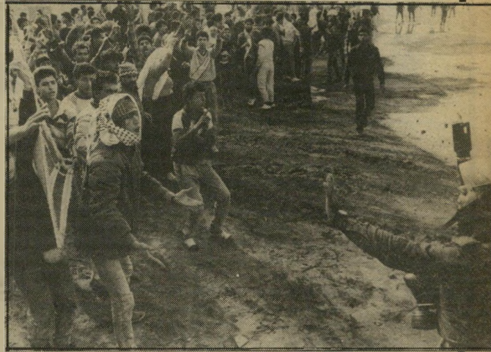
זעקת ההמון אפי שריר צילם בעזה, במחנה הפליטים אל-צה"ל. "בצילום יש סימליות, דינמיקה של קבוצת הצעירים מול היד. היד חזקה מהאלה. אם תהיה להם מדינה, לנו יהיה שקט ואפשרות לחיות."