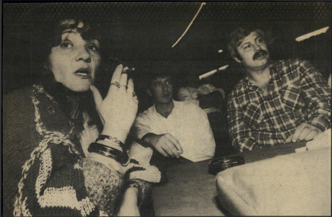
באנו, למרות השידור בטלוויזיה, כדי לחוש את האווירה. אנחנו אוהדים שרופים של הדנבר ברונקוס (סוסים). המישחק לאט-לאט חודר גם למדינה."