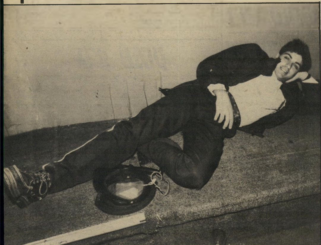
שעות שמירה. צריך לאגור כוח. הוא כבר ראה הרבה מופעים בחייו. קשה לו להתלהב. במיוחד כשהוא לא מבין בכלל את החוקים של המישחק המסובך הזה.

לא מעוניין שומר ב, סינרמה" תופס שלווה. לגביו המישחק לא מוסיף ולא גורע. ארבע שעות צפייה במישחק אינם כמו ארבע