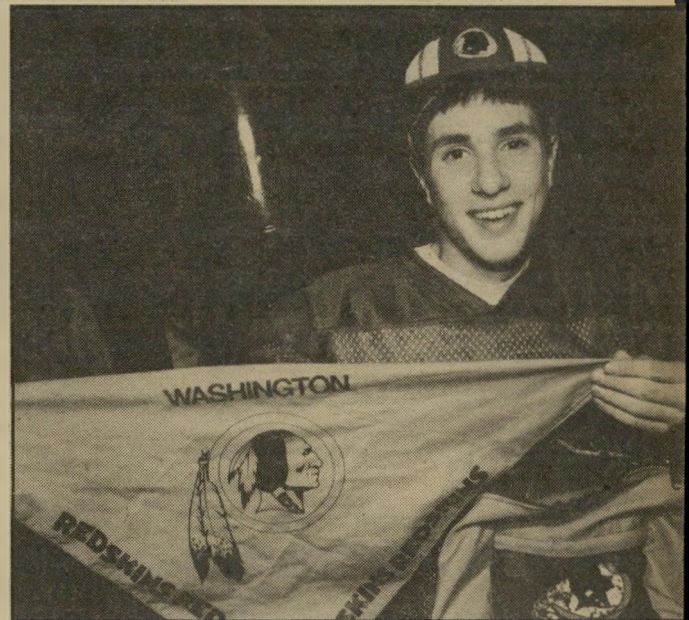
אינדיאני מירושלים גיא עדן מירושלים, אוהד שרון של הרדסקינס, לבוש בביגדי ה"קבוצה, נושא דגלים. "הטקטיקה, הפעולה והאווירה מלהיבים במיוחד."