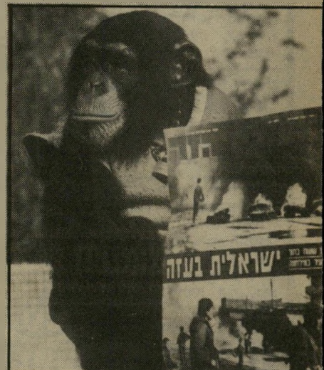
שער „העולם הזה“ על ההתקוממות האם זה כדאי?

אם כן, מדוע העז העולם הזה להקדיש שבוע אחר שבוע את עמודיו ושעריו להתקוממות