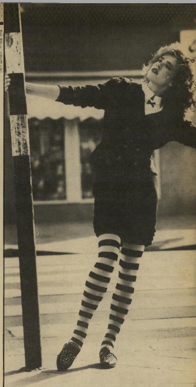
מעבר-חציה מערכת בשני חלקים בצבע שחור - ג'קט צמוד בעל רכיסה כפולה של כפתורי-מלחים מוזהבים מעל לחצאית-מיני בעלת שלושה קיפלוניים במכפלת. בבטיק, "אורל".