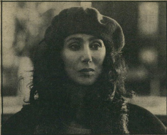
שר - בתפקיד ריילי, פרקליטת מדינה עקשנית

קוויד מצליח לעבור מחלקקות ושינוטוני דוחה