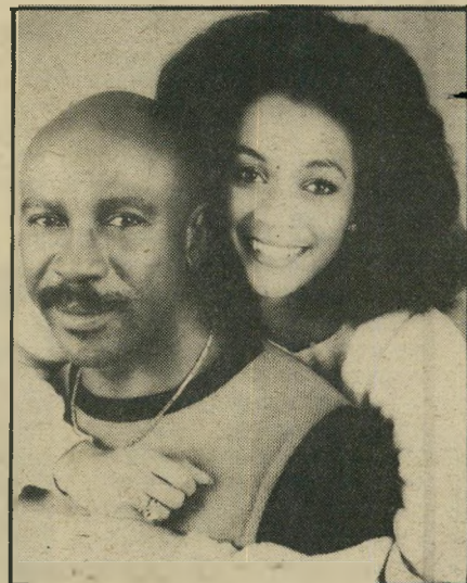
סינדי ולו גוסט קוראנית ופרוסת'לחם

איך אפשר שלא להעריץ את האישי הזה? שחקן נפלא (קצין וג'נטלמן, נערי המקהלה, שורשים) ויריד נאמן, הוא נמצא בישראל בפעם השלישית: "יש לי מישפחה כאן, מיה כל מי