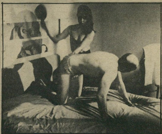
נערה עובדת בשפוט עבודתה - תחקיר מייגע

מה שפחות משכנע כסרט באורך מלא היא העובדה שאת