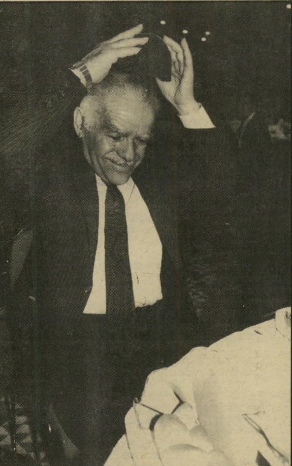
יצחק שמיר היה אורח־הכבוד באירוע לציון שנת ה־15 ל"ישיבת־הגולן". ישיבה זאת נמנית עם ישיבות־ההסדר. התלמידים חובשים כיפה סרוגה. יועצי ראש־הממשלה לא ידעו זאת כנראה ושמיר הופיע כשהוא חובש כיפה שחורה, שבלטה על רקע מאות החוגגים שחבשו כיפות סרוגות.