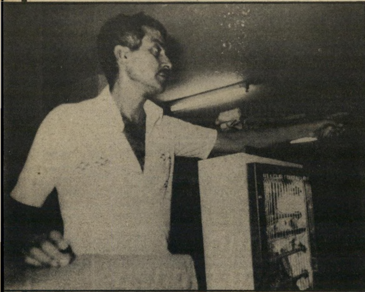
מזכיר ברעמי לא נשבר

לא היה כל לחץ על המישטרה והפרק ליתות לסגור את הפרשה. להיפך, גם שרה-מישפט אברהם שריד, וגם נשיא בית-המישפט העליון, השופט מאיר שמגר, התאמצו להוציא את האמת לאור.