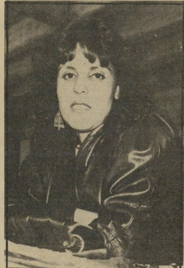
שוטרת סוויסה, הכל עליהם

אני כבר יושב שיבעה חודשים, ואני לא יודע על מה, כעת אני רוצה לספר לכם את הכל! אמר לשופטים.