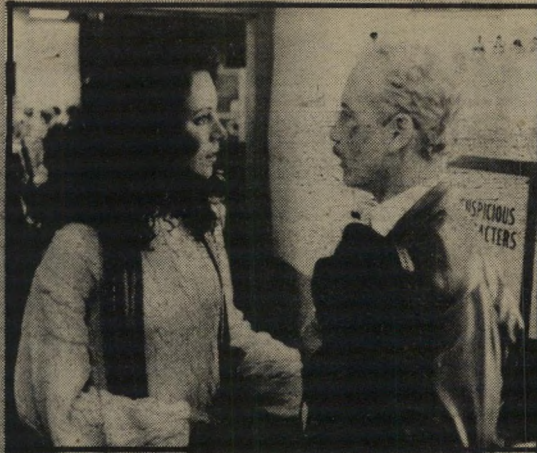
ריצ'ארד דרייפוס ומאדלין סטאן - לא מבריק

באמתלא כלשהי, ועד מהרה הוא מוצא שקשה מאוד לעבוד את הכביש בחזרה ולחשתמק בתפקיד של צופה מן הצד. גם החלק הזה, שוטר שמתאהב בנושא הקירותו מגלי שהיא ידעת שהוא שוטר, אינו בדיק חדש. באדהם, שהואמיקצוען שלממשל-אוכריס את מישחקי פילחמה ואת רעם כחול) יודע בדיק כמה דם צריך לשפוך, וכמה בדי- חות צריך לספר, ובסוף מלס יוצאים מחויבים, ושבעי-דיון.