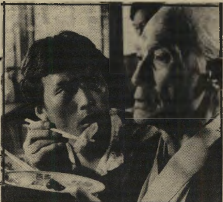
שחקנים ראשונים ואומדמוז בסרט מאמפופו

*** טאמסופו (לב, תל-אביב, יפאן) — יחו איטאמי, מהמרתקים שבכימאים הצעירים ביפאן תוקע מולג בהררי-הולילה של האומה העי סוקה במידרפי תענוגות. אלמנה צעירה עורכת מסע מסורף של ריגול תעשייתי גאסטרונמי משעשע.