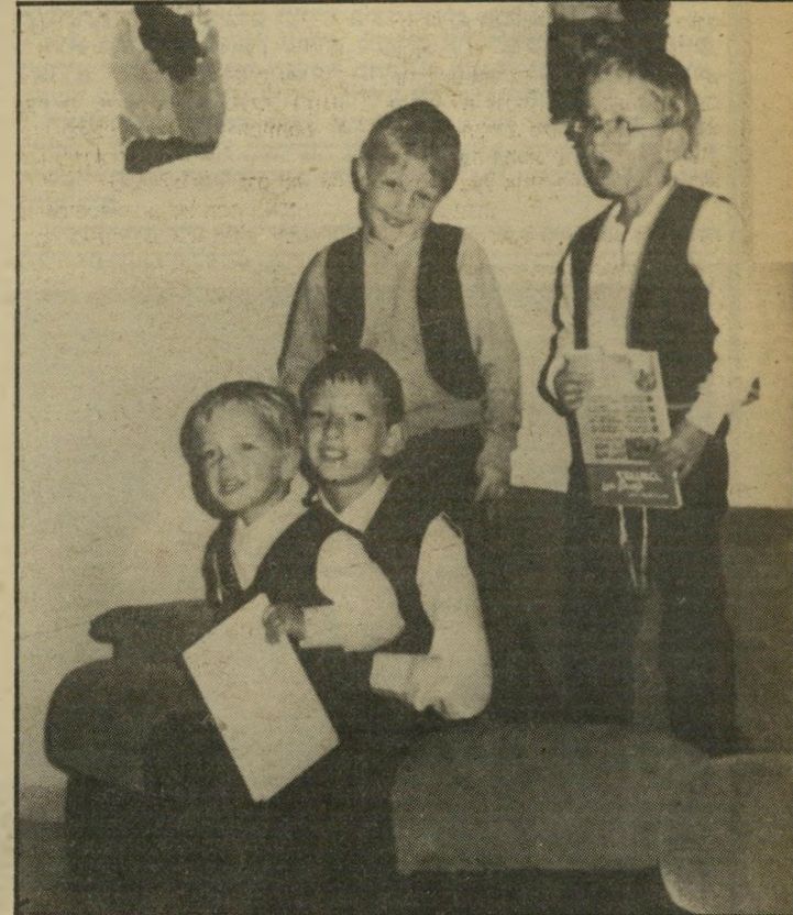
ילדי מרשק הילדים חיו בתנאים מחפירים. בתוך עזובה וליכלוך

כשפגשה לראשונה את ילדיה הם היו מנותקים, מבוהלים ומפחדים. הם פחדו לדבר ללא רשות אביהם. הוא הסית אותם נגדה, בטענה שהיא אינה יהודייה והיא מעוניינת רק בכסף. הוא אף הסית אותם לחשוב כי אמם לא מתעניינת בהם וכי לא עשתה כל מאמץ כדי למצוא אותם. חמישה ימים אחרי-כך פגשה בהם בפעם השנייה. שלדון הביא עימו ארוחת צהריים, ולדיברי קרול היתה זו פגישה נעימה.