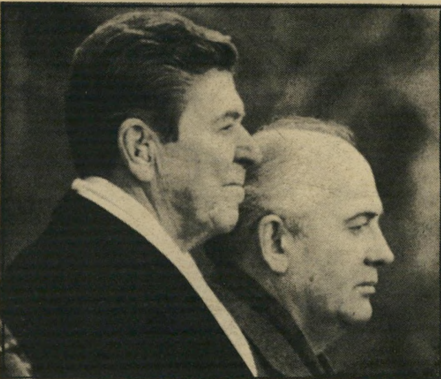
גורבאצ'וב עם רגן וכונו

(למעשה היה קיים רק ב-1947 הסכם בין האמריקאים והסובייטים, והסכם זה הוליד את התוכנית להקים בארץ מדינה יהודית ומדינה ערבית. פעולה משותפת