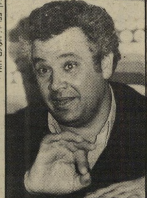
ציון צפריה, העולם הזה

מכיוון שמדינת ישראל לא הגישה בקשת הסגרה לגניש גניש, הרי שיוכל לבחור את היעד שאליו יגורש. גניש הצליח לקבל גרין קארד באמצעות קונסול אמריקאי בסיאול, שעזמו קשר קשרים כאשר זה עבד בשגרירות ארצות הברית בישראל. שילטונות ההגירה העבירו לאף-ביאיי את התיק, כדי שיחליטו אם להעמיד לדין גם את הקונסול, שפעל בניגוד לחוק.