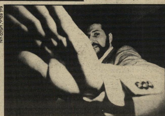
בנקאי רקנאטי משבר הבורסה לא השפיע