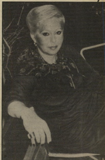
ניצתה מעוז הזומה ב-12 אלף דולר

המצחקי בכל הפרשה הוא שכיום מרבית הבגדים כבר מיושנים מבחינת העיתוי. אז מהו מוסר השכל של הפרשה? אם את כבר מוציאה 12 אלף דולר על בגדים, מוטב שזה יהיה ג'ינס וטרקו, כי גם בשנת 2001 הם עדיין יישארו באופנה.