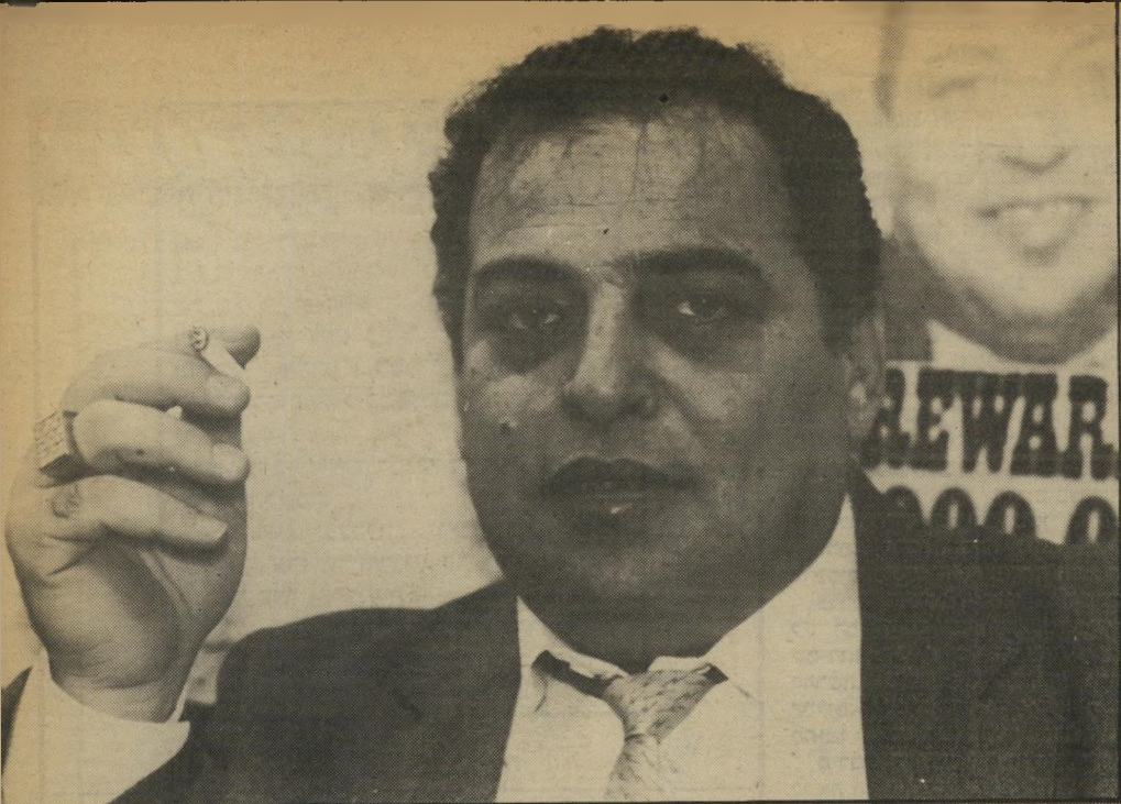
אווזי במיסעדה (מאחוריו: כרזה היתולית שבה הוא מופיע כפושע מבוקש) הפרס: מיליון דולר