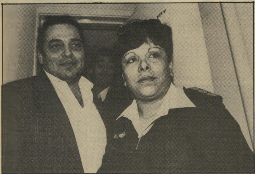
אווזי עם קצינת-מישטרה בבית-המישפט שיחרור בערבות עצמית

ועל כוונתו לפתוח בקרוב מיסעדה חדשה ליד צומת גלילות, שתוכל להכיל 800 איש.