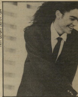
ניני פעם ראשונה שאני אוהב ככה"

גם בארץ הוא כיום מעצב־אופנה, מאפר ומרגמן, "אמן" כהגדרתו. הבעיה המרכזית כמה שאני עוסק