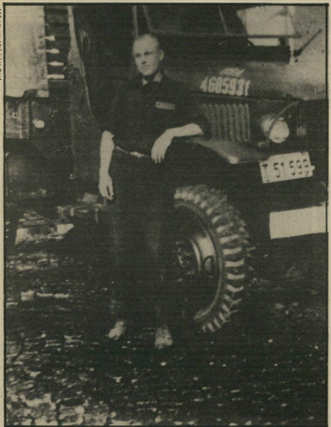
אילינו הראתי חזרת