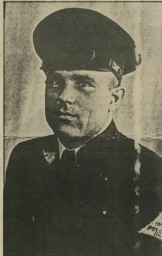
תמונת-המריבה: דמיאניוק במדי-המישפטה* ..לא פרחתי אפילו לשאול אותו...

ב יומו האחרון של מישפט איי וואן דמיאניוק, התעוררה שאלה בדבר תצלומי של הנאשם במדי-מישפטה. תמונה זו יוחסה לתקופה בה שהה בלנדצהוט בשנת 1946, והפסיכולוג וילם ואכנאר, שהעיד כמומחה מטעם ההגנה לענייני זיכרון, הסתייע בה ואמר כי כפי שהנאשם שכח את התקרי פה שבה כרה כבול בעיר חלם. כך שכח גם את התקופה שבה היה שוטר ב" לנדצהוט.